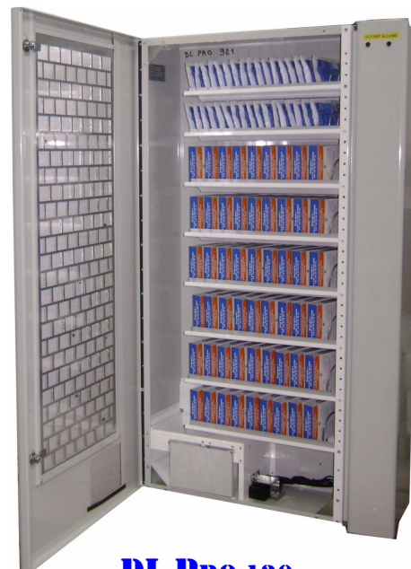
DL PRO 120

220 Volts – Gestion par électronique Mise en route par centrale (pas de monnayeur) Carrosserie gris clair