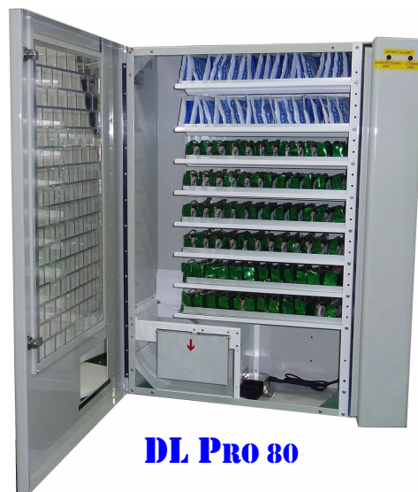
DL PRO 80